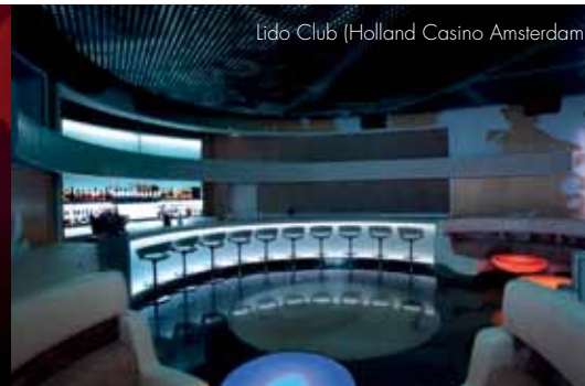
Lido Club (Holland Casino Amsterdam)

Om een volwaardige 5D experience te ervaren raden wij u aan eens de Lido Club (in Holland Casino Amsterdam) te bezoeken. Wij hebben, in samenwerking met Holland Casino en andere partijen, een ultieme belevingsruimte gerealiseerd. Alle zintuigen worden geprikkeld en alle prikkelingen zijn op elkaar afgestemd, waarmee u een vernieuwende avond in een intieme en ontspannende setting beleeft. Alles in aanwezig: muziek, interactieve games, mooie geuren, een plafond met 42.000 led lampjes waarmee bewegend beeld rechtstreeks van de wand naar het plafond kan worden doorgezet, een 'moodjockey' (niet enkel een DJ!), gamepods en natuurlijk de bekende speeltafels. Een unieke ervaring!