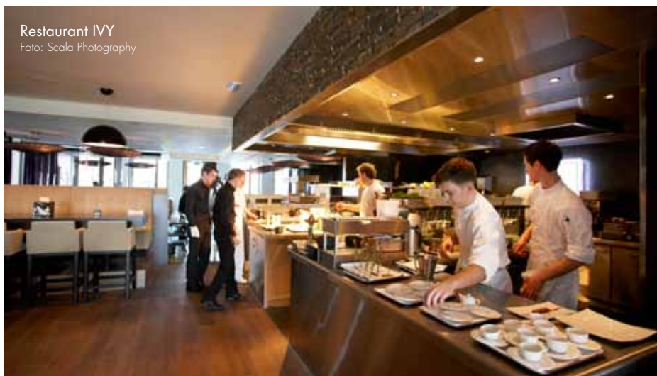
Restaurant IVY