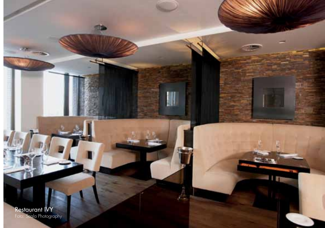
Restaurant IVY

in Rotterdam hebben wij een custom made 'geur chef's table' ontwikkeld. Dit is een geurtafel, die met behulp van een afstandsbediening verschillende geuren verspreidt. Hiermee worden gasten van Ivy tijdens het eten op een speciale manier geprikkeld en beleven ze hun diner op een unieke manier.