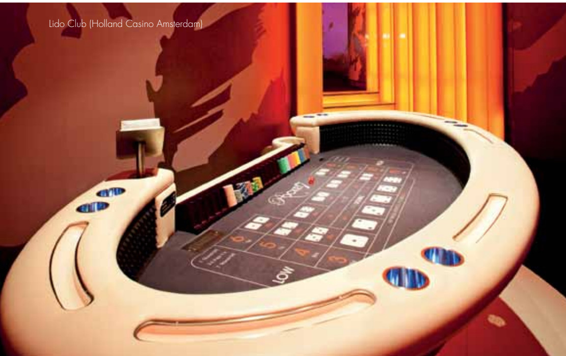
Lido Club (Holland Casino Amsterdam)

Sinds midden jaren '90 zijn er in Las Vegas vrijwel geen casino's zonder geursysteem. Enig idee waarom? En lees meer over de mede door ons gerealiseerde ultieme 5D speelomgeving in Holland Casino Amsterdam; Lido Club. Hier zijn alle zintuigprikkelingen op elkaar afgestemd.