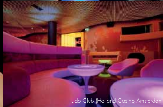
Lido Club (Holland Casino Amsterdam)